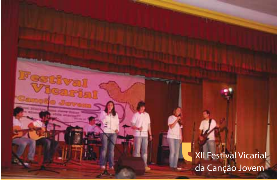
XII Festival Vicarial da Canção Jovem