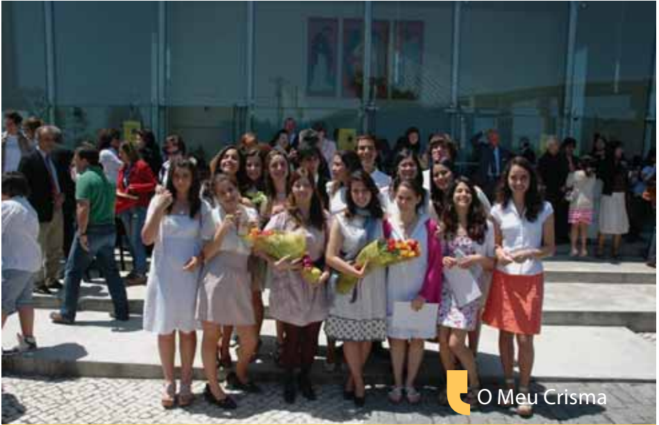
O Meu Crisma

Quando ouvia as pessoas falar de como era serem confirmadas, nunca pensei que por trás houvesse uma caminhada tão enriquecedora, gratificante e compensadora. Pensava que iria ser mais um ano de catequese apenas mais focado para aquele momento especial, mas foi muito mais do que isso.